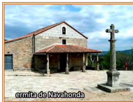
ermita de Navahonda