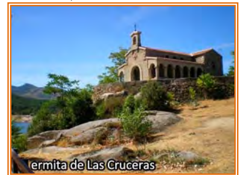
ermita de Las Cruceras