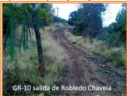
GR-10 salida de Robledo Chavela

punto de San Juan. Cruzamos por el puente nuevo, a la derecha se muestran el puente viejo y el paredón de la Presa de San Juan y por la izquierda el río Alberche se vuelve a embalsar en el embalse de Picadas y sirve de playa a los madrileños. Después del puente alcanzamos una rotonda y seguimos en dirección a Pelayos de la Presa, pero casi de inmediato cogemos un desvío a la derecha hacia el embalse de San Juan que nos pasa por delante de una gasolinera. En las cercanías del pantano el asfalto se acaba y sigue la pista de tierra, tendremos que plantearnos la posibilidad de un baño en la playa cercana del pantano.