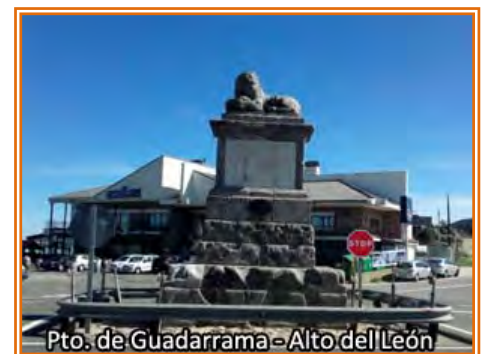
Pto. de Guadarrama - Alto del León

de nuevo con el PR-M30 en un recorrido de unos 3 km, en este tramo de subida podremos contemplar varios fortines de la guerra civil. De nuevo por el PR-M30, salvamos el barranco del “Arroyo de la Peñota”. A partir de aquí el camino asciende por la ladera de la Sierra de Guadarrama durante unos 4,5 km hasta conectar con la N-VI, la cogemos por la derecha para en 1 km coronar el Puerto de Guadarrama en el Alto del León donde podremos reavituallarnos. Continuamos por una pista que sale por el lateral del Restaurante El león, dejamos a la izquierda un fortín de la guerra civil y poco después a la derecha las instalaciones de las antenas de telecomunicaciones y el indicador de Pegerinos (Ávila). Durante los siguientes 4,5 km la pista sigue más o menos paralela el cordel de la sierra por su vertiente madrileña,