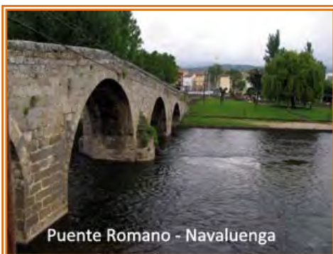
Puente Romano - Navaluenga

izquierda del Alberche casi paralela a la carretera.