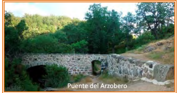
Puente del Anzobero