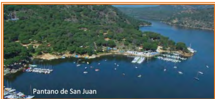
Pantano de San Juan