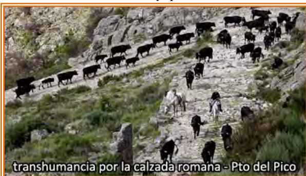
transhumancia por la calzada romana - Pto del Pico

el “Puerto del Pico”. Aquí tendremos estupendas panorámicas del “valle del Tietar” desde el mirador de la 5 villas y desde la terraza del restaurante o desde el monumento a los caídos. En el puerto cogemos por la derecha una pista que deja a su izquierda el monumento de los caídos y que en unos 2,7 km nos lleva a conectar con el “Cordel de ganados de Piedrahíta al puerto del Pico”, por