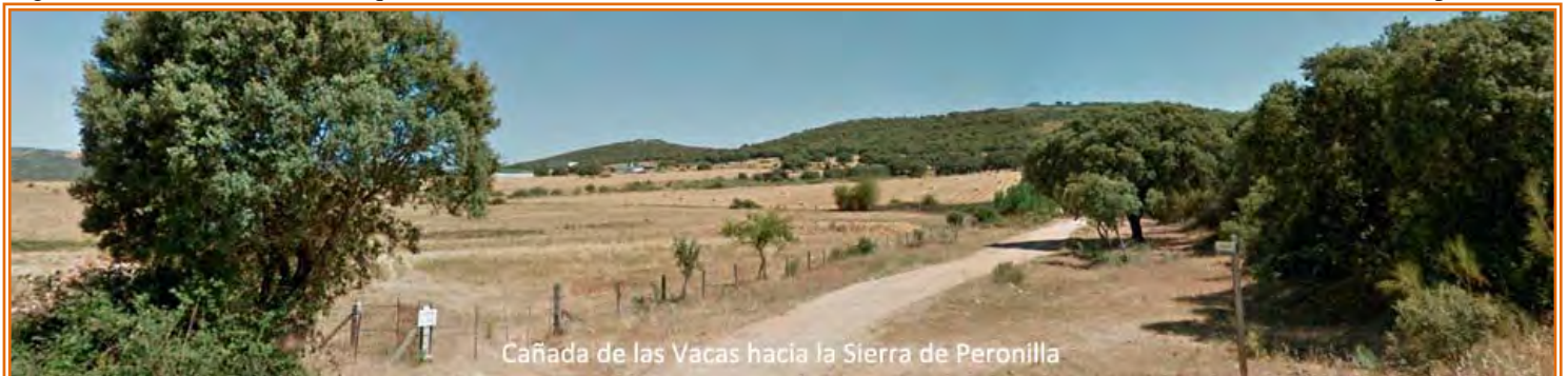
Cañada de las Vacas hacia la Sierra de Peronilla

Agustín de Foxá y a su final cruzamos la autovía por un elevado y enseguida cogemos una pista asfaltada que sale en ángulo por la izquierda, con panel informativo de “Ruta de la Sierra de Camaces”. Poco después de pasar por delante de la casa rural La Noria y un diseminado de casas se acaba el asfalto y seguimos por pista de tierra para conectar con la “Cañada o Vado de las Vacas” que la cogemos por la izquierda dejando de inmediato por la derecha la “Ermita de Nra. Sra. de la Peña de Francia”. Tras unos 3,5 km nos encontramos con el primer cruce de carretera, donde empezamos a imaginarnos los inconvenientes que tendrán para los pastores del ganado trashumante cada vez que se encuentren con estas travesías de asfalto con tráfico rodado, en este caso la SA-220. En poco