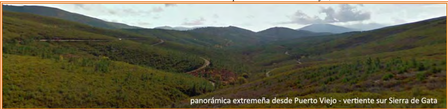
panorámica extremeña desde Puerto Viejo - vertiente sur Sierra de Gata

tiene una subida de unos 500 m con pendientes del 11-12 % hasta alcanzar un collado. Arriba la pista conecta con otra que la cogemos por la derecha para enseguida coger otra por la izquierda (haciendo una “z”), para por ella descender hacia al “arroyo de la Vega del Caballo”. Una vez cruzado el arroyo tenemos casi 11 km alternado caminos y pistas forestales remontando la ladera salmantina de la sierra hasta alcanzar el “Collado de Puerto Viejo” en el cordel de la Sierra de Gata que ejerce de límite entre CC. AA. en las provincias de Salamanca y Cáceres. La vertiente sur de la sierra nos muestra la panorámica de Las Hurdes extremeñas. Tras “asomarnos” a Extremadura volvemos a la vertiente salmantina para durante unos 2,2 km bordear la loma de Canalejas y volver al cordel de la sierra donde nos encontramos con la carretera que la cruza en “Puerto Viejo”, de nuevo con Las Hurdes al