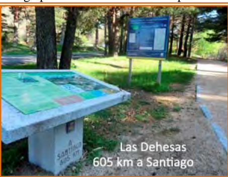
Las Dehesas 605 km a Santiago

Después de los miradores de los poetas, la pista regresa de nuevo en descenso otros 3 km hacia el barranco del arroyo de la Navazuela y poco después el arroyo de la Fuenfría por donde baja la calzada romana. El camino sigue descendiendo el valle y al poco le llega por la derecha el sendero por donde baja la TI original, la ruta no entra en Cercedilla sino que la rodea por el oeste. Por una estrecha pista recién asfaltada sumergidos entre bosque de altos pinos, dejamos a la izquierda la Escuela de Ingenieros de Montes, junto a la Casa forestal de Las Dehesas y el embalse Las Berceas y poco después pasamos por delante del Sanatorio de la Fuenfría. A continuación dejamos Las Dehesas a nuestra izquierda y seguimos por el “Camino de los Campamentos” que coincide con el PR-M30. Dejamos a la izquierda primero el “Campamento de los Helechos” y poco después el desvío al “Campamento de la Peñota”. Poco después dejamos el camino de los campamentos que sigue hacia el núcleo urbano de La Cercedilla y cogemos por la derecha el “Camino de la Solana” donde tendremos dos alternativas, una seguir el PR-M30 por la derecha un tramo de 1,5 km de senda de caminantes que mantiene la altura por la ladera de la sierra, la segunda opción que coincide con la TI es seguir el Camino de la Solana que pierde altura hasta encontrarse con la vía férrea y que después vuelve a remontar la sierra hasta encontrarse