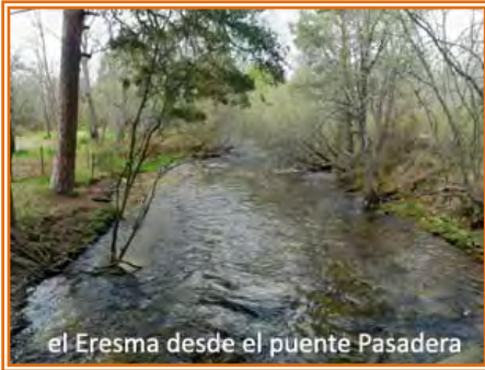
el Eresma desde el puente Pasadera