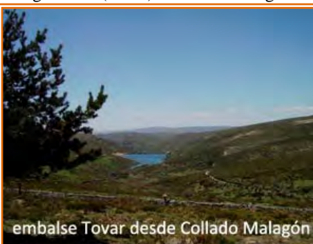
embalse Tovar desde Collado Malagón

salvamos primero el “collado de la Gasca” y después bordeamos el pico “Cabeza Lijar” para coronar el “collado de la Cierva o de la Mina” (1720 m) donde cruzamos el cordel de la sierra saltando a la provincia de Avila por su municipio de Pegerinos. Comenzamos a bajar por asfalto con mejor firme, pasamos el collado del Hornillo y, después de una larga recta, estamos atentos a un desvío a la izquierda que nos mete de nuevo en pista de tierra durante unos 5 km en falso llano, por el camino de Canto Herrero, que nos lleva a pasar junto al campamento de Peñas Blancas para después volver a conectar con el asfalto. Cogemos la pista asfaltada por la izquierda y al poco pasamos por delante del refugio forestal “La Casa de la Cueva”, donde se inicia el ascenso de unos 3 km hasta el siguiente collado, de retorno a la comunidad madrileña salvamos un paso canadiense para ganado y a continuación descendemos 1.7 km hasta el collado Malagón.