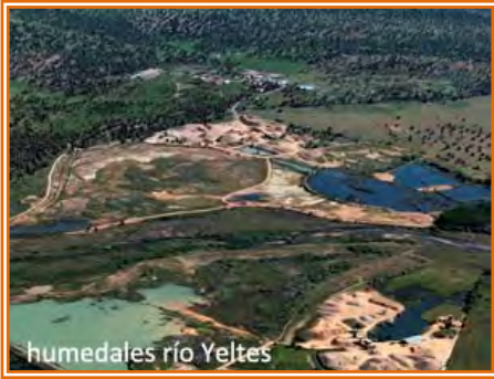
humedales río Yeltes

Después de vadear el Yeltes continuamos por la cañada otros 5 km hasta encontrarnos con la CV-31. Atravesamos la carretera y