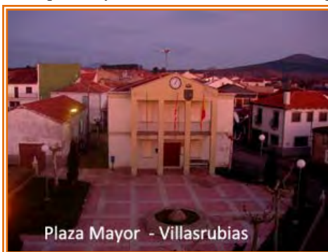
Plaza Mayor - Villasrubias

cogemos por la derecha la CV-199 y en menos de 0.5 km cogemos por la izquierda una pista que nos señala el A. R. de Charco Palo y que atravesando la “Dehesa del Payo” en unos 3 km nos lleva hasta el río Payo, donde nos encontramos con la fuente Fría que hace honor a su nombre con un abundante caño de agua para el disfrute de los usuarios de la sombreada área recreativa. Después de cruzar el río nos quedan algo más de 6 km siempre hacia el oeste rodeados de robles y castaños y pasando por la Casa de Pintamonas antes de rematar la etapa cruzando el río Águeda en la entrada a Navasfrías .