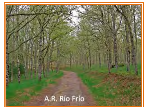
A.R. Río Frío