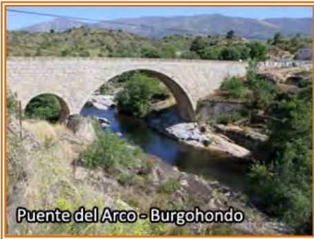
Puente del Arco - Burghondo

Nosotros en Puente Nueva abandonamos el trazado original de la TI y cruzaremos el puente sobre el Alberche para acercarnos a Burghondo. En la entrada del pueblo conectamos con la carretera que sube a la sierra hacia Serranillos y Mijares, al poco la carretera se abre en dos, por la izquierda se va en dirección Mijares pasando por Villanueva de Ávila (6 km) y de frente hacia Serranillos (17 km) pasando por Navarrevisca. Todas las alternativas llevan a Serranillos incluida la TI original, no obstante aquí describimos la alternativa intermedia por la AV-901 hacia Villanueva de Ávila. Después del desvío salvamos de nuevo el Alberche por el “Puente del Arco” y durante los siguientes 4 km la carretera, que no es más que una antigua pista asfaltada, va cogiendo altura con el valle del Alberche por la derecha, hasta llegar a Villanueva de Ávila. Atravesamos la localidad y en poco más de 1 km nos encontramos con el trazado de la TI que nos llega por la izquierda y con una pista asfaltada (AV-P-420) que sale por la derecha. Aquí de nuevo tenemos dos alternativas: la más cómoda es coger la pista asfaltada por la derecha y que en unos de 7 km nos lleva por las laderas medias de la sierra hasta conectar con la carretera de Serranillos en la entrada de Navarrevisca, a