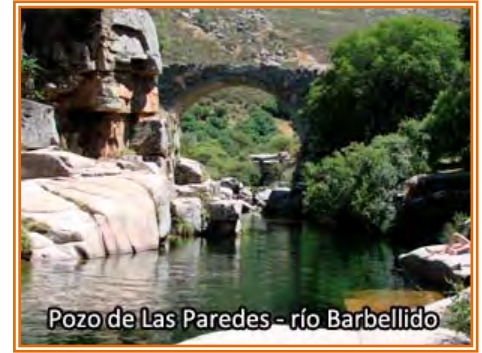
Pozo de Las Paredes - río Barbellido

la carretera 5 km hasta Navalperal del Tormes y 10 km después Aliseda de Tormes. A poco más de 6 km después de Alisea tenemos la opción de abandonar la carretera y coger