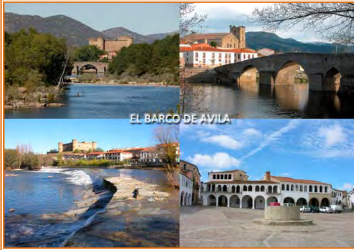
EL BARCO DE AVILA

la carretera 5 km hasta Navalperal del Tormes y 10 km después Aliseda de Tormes. A poco más de 6 km después de Alisea tenemos la opción de abandonar la carretera y coger