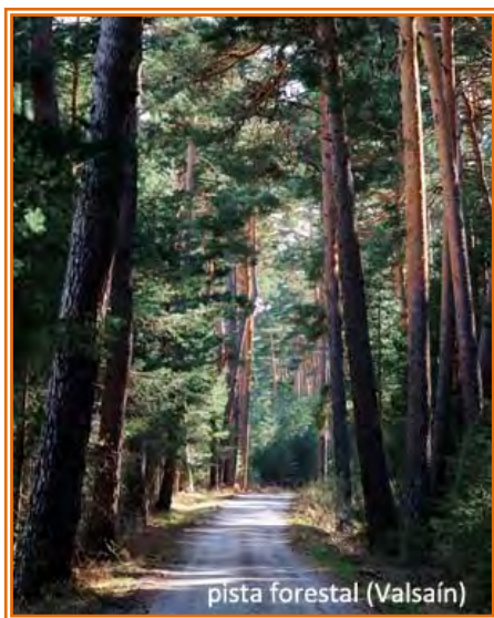
pista forestal (Valsaín)