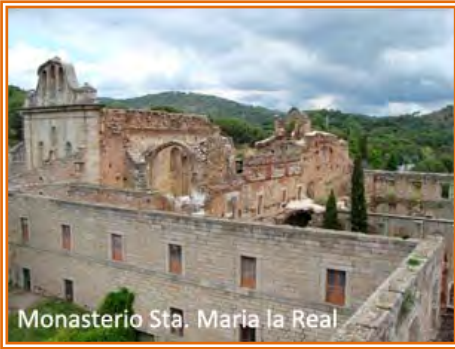
Monasterio Sta. Maria la Real