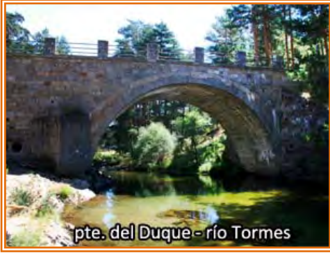
pte. del Duque - río Tormes

En el Puente del Duque cruzamos la AV-931 y seguimos de frente dejamos el camping y seguimos la ribera derecha del Tormes. En algo menos de 8 km nos encontramos con la carretera que lleva a Navacepeda de Tormes y por la izquierda un puente sobre el Tormes que nos permitirá acercarnos al área recreativa de la “Poza de las Paredes” sobre el río Barbellido (afluente del Tormes) que se encuentra como a 1 km de nuestro camino. A partir de aquí quedan escasos 30 km hasta Barco de Avila, el recorrido alterna el “Cordel del Barco de Avila” con la carretera C-500, en función de las lluvias el piso del cordel puede estar embarrado y encharcado así que en este caso se recomienda entrar en Navacepeda y seguir por