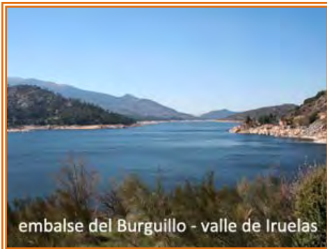
embalse del Burguillo - valle de Iruelas

Si no queremos visitar los Toros de guisando, salimos de San Martín por el “camino de la Aliseda” y tenemos unos 5,5 km en falso llano hasta el “arroyo Tórtolas” que sirve de frontera entre la provincia de Madrid y Ávila, cruzamos el arroyo y a continuación cruzamos la carretera AV-502. Después nos quedan unos 6,5 km donde se alternan la pista de tierra y el asfalto hasta llegar al pueblo de El Tiemblo. Salimos del pueblo por la N403-A, que en 4 km nos acerca a la presa del “Pantano del Burguillo” que también es alimentado por el río Alberche. A partir de aquí nos internamos en el entorno de La Reserva Natural Valle de Iruelas ,