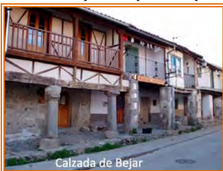
Calzada de Béjar

visitar sus monumentos más emblemáticos y, como no, darnos un “homenaje” gastronómico antes de continuar la etapa, por eso “nuestro” track atraviesa la ciudad de Béjar y luego baja siguiendo el curso del río hacia el pueblo La Calzada de Béjar, lugar de tránsito de la Vía de la Plata. Si queremos “rodar” un par de km por la ruta peregrina nos podremos desviar en el fondo del valle hacia la izquierda y por la derecha coger el camino de la Vía de la Plata para entrar en el pueblo. Atravesamos el pueblo y siguiendo por una preciosa carretera local arbolada (CV-635) entre parcelas de pasto de ganado a unos 4 km alcanzamos la localidad de Valdehijaderos. Otros 4 km más de carretera, entre campos de pasto de vacuno y con la Sierra de Francia en el horizonte,