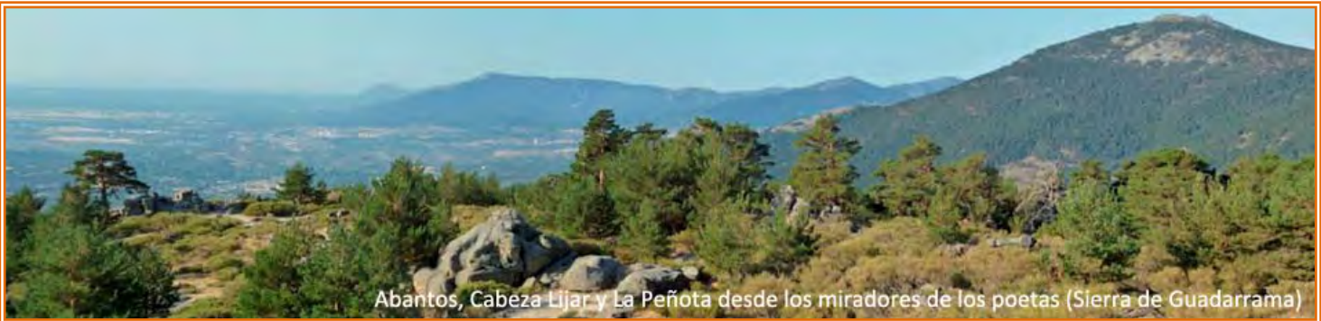
Abantos, Cabeza Lijar y La Peñota desde los miradores de los poetas (Sierra de Guadarrama)

El camino parte del puerto de Fuenfría y en menos de 1 km nos acerca al “mirador de La Reina o de La Calva”, continúa en ligero descenso para salvar el barranco del “arroyo de la Navazuela” por el puente de Hierro. Después sigue algo más de 3 km hacia los