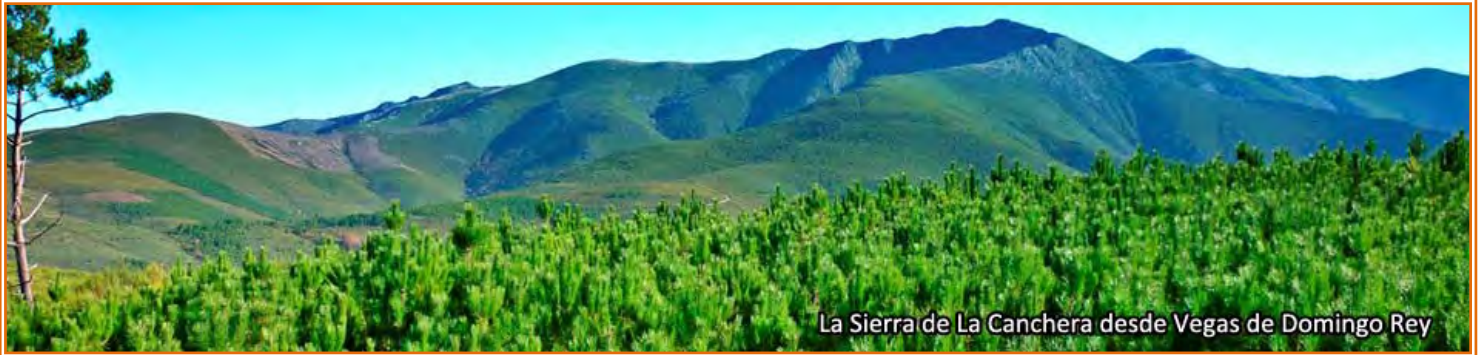
La Sierra de La Canchera desde Vegas de Domingo Rey

Salimos de Vegas de Domingo Rey por el sur bajando a su vega y cruzamos primero el “arroyo de la Canchera”, se acaba el asfalto y seguimos por una pista de tierra para cruzar el “arroyo de la Huerdana” y al poco cogemos un desvío por la izquierda. La pista