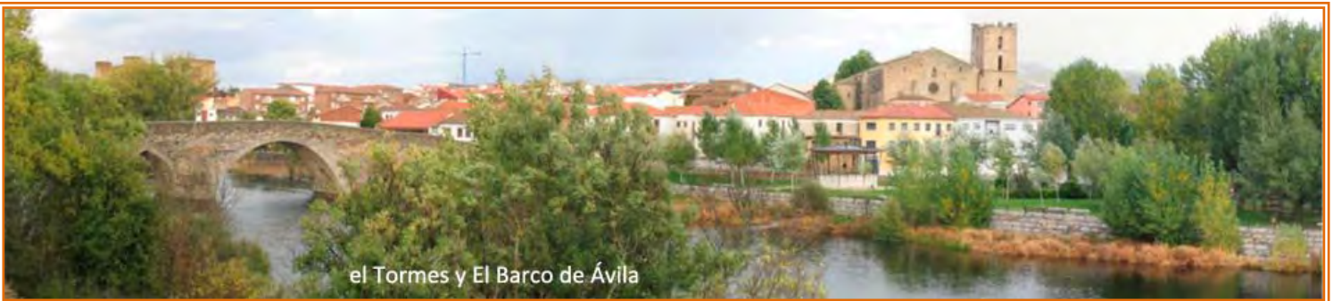
el Tormes y El Barco de Ávila

4.- El Barco de Ávila – Miranda del Castañar (81 km). Dejamos atrás las cumbres de la Sierra de Gredos aunque en la primera parte de la etapa aún nos movemos por el entorno del Parque Regional Sierra de Gredos. Salimos de El Barco cruzando el puente medieval sobre el Tormes y enseguida cogemos por la izquierda la carretera que sigue el margen del río y que en 0.5 km la abandonamos por un desvío a la derecha que entra en una urbanización de la que sale por pista de tierra para en 1 km encontrarnos