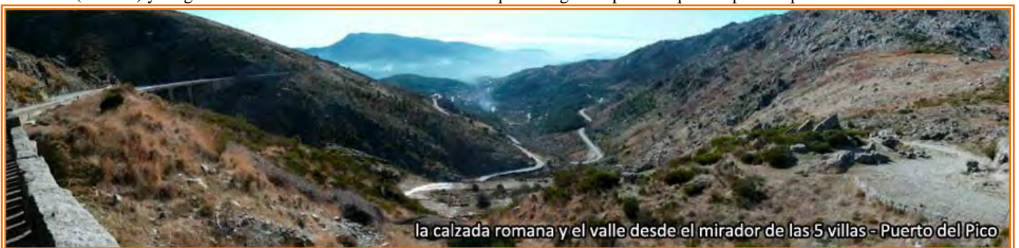
la calzada romana y el valle desde el mirador de las 5 villas - Puerto del Pico

el “Puerto del Pico”. Aquí tendremos estupendas panorámicas del “valle del Tietar” desde el mirador de la 5 villas y desde la terraza del restaurante o desde el monumento a los caídos. En el puerto cogemos por la derecha una pista que deja a su izquierda el monumento de los caídos y que en unos 2,7 km nos lleva a conectar con el “Cordel de ganados de Piedrahíta al puerto del Pico”, por