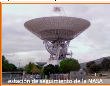
estación de seguimiento de la NASA