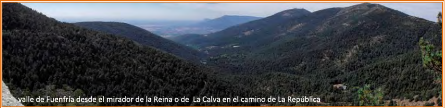
valle de Fuenfría desde el mirador de la Reina o de La Calva en el camino de La República

ladera de la sierra permitiéndonos pasar por varios miradores desde los que disponemos de espectaculares panorámicas del valle y de los picos de la Sierra de Guadarrama, bordeando la “sierra de los siete picos” por sus laderas occidentales.