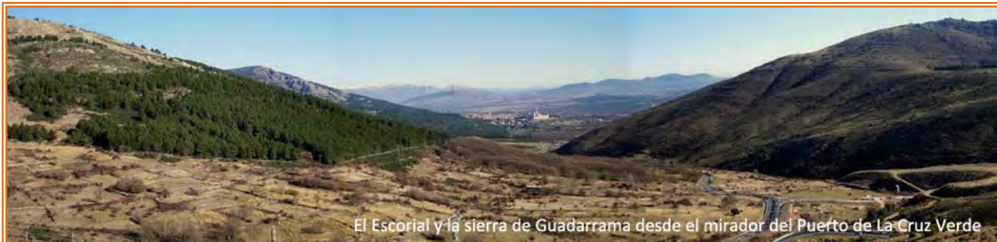
El Escorial y la sierra de Guadarrama desde el mirador del Puerto de La Cruz Verde

Con el “Pico de Abantos” por nuestra izquierda, desde el puerto de Malagón se puede descender hasta San Lorenzo del Escorial si se desea visitar el monasterio. La TI no baja y en el mismo collado salva una barrera con paso canadiense y sigue de frente por el “camino del Pinar” por las laderas del “Cerro de la Cabeza”, por una zona de páramo primero en falso llano y después bajando en zig-zag hasta las inmediaciones de Robledondo, el pueblo lo dejamos a la derecha del camino a no ser que queramos entrar en el mismo para “refrescarnos”. La carretera de Robledondo nos conecta con la M-505 a la altura del puerto de La Paradilla, la cogemos por la izquierda hacia El Escorial en descenso hacia el puerto de la Cruz Verde. Antes de llegar a la rotonda del puerto, un mirador