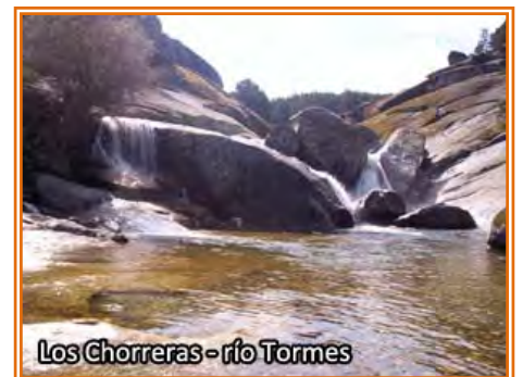
Los Chorreras - río Tormes

el que es fácil imaginarse a las ganaderías en su trashumancia en busca de los pastos en verano. El cordel es un camino en sube y baja variado y técnico que en poco menos de 6 km nos lleva a la dehesa y casas de Navarenas y, esquivando el asfalto de la C-500, sigue algo más de 5 km por las praderas y el pinar de Navarredonda de Gredos hasta encontramos con el río Tormes y el área recreativa de Tambosríos. A partir de aquí seguimos el “Cordel del Barco de Ávila”, al principio asfaltado,