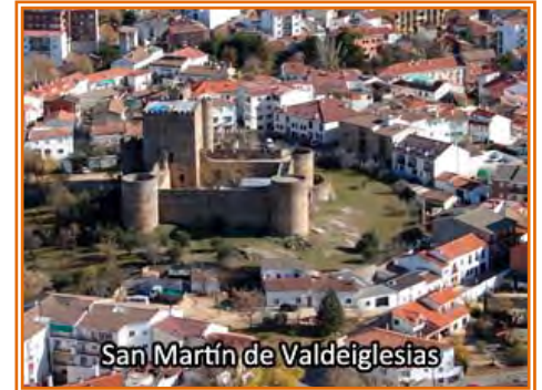
San Martín de Valdeiglesias

el siglo XV como residencia y pabellón de caza de Alvaro de Luna, se encuentra en un buen estado de conservación, como consecuencia de varias obras de rehabilitación, emprendidas hacia 1940 y en los primeros años del siglo XXI. Su propiedad corresponde a la Fundación Castillo de la Coracera, constituida en el año 2003. Esta entidad, formada por el Ayuntamiento de San Martín de Valdeiglesias y un particular, está rehabilitando el edificio para su uso público. En él se va a instalar el Museo de los Vinos de Madrid y está previsto que albergue otras dependencias, destinadas a la difusión turística y cultural de la zona. En San Martín nos tenemos que plantear la oportunidad de visitar “ Los Toros de Guisando ”, ello supone una variación respecto al trazado de la TI, tendríamos que salir del Pueblo buscando la N-403 y a la altura del servicio oficial Peugeot (nave industrial) coger una pista (GR-10) que conecta con la M-501 por la que circularíamos un tramo para luego coger por la derecha en dirección a El Tiemblo y en poco más de 2 km nos encontramos los Toros a la derecha.