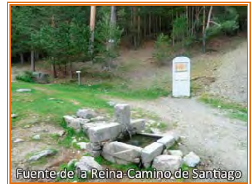
Fuente de la Reina-Camino de Santiago

sentido contrario por el Camino de Madrid que atraviesa las tierras castellanas hasta Sahagún. Después de la fuente nos quedan unos 3,5 km hasta el puerto de la Fuenfría que ejerce de frontera entre CC. AA.