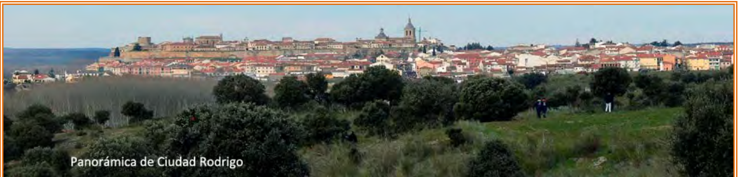
Panorámica de Ciudad Rodrigo

8.- Ciudad Rodrigo - Salamanca (98 km). Son casi 100 km siguiendo los trazados de diversas vías pecuarias por las dehesas del campo charro de la meseta central, un terreno llano o ligeramente ondulado con encinas y pastos en los que podemos contemplar la ganadería, compuesta principalmente de reses de raza brava o morucha y cerdo ibérico, pastando libremente entre las encinas. Algunas de las más famosas ganaderías de toros de lidia se encuentran en estas tierras. Salimos de la ciudad amurallada por la Avda.