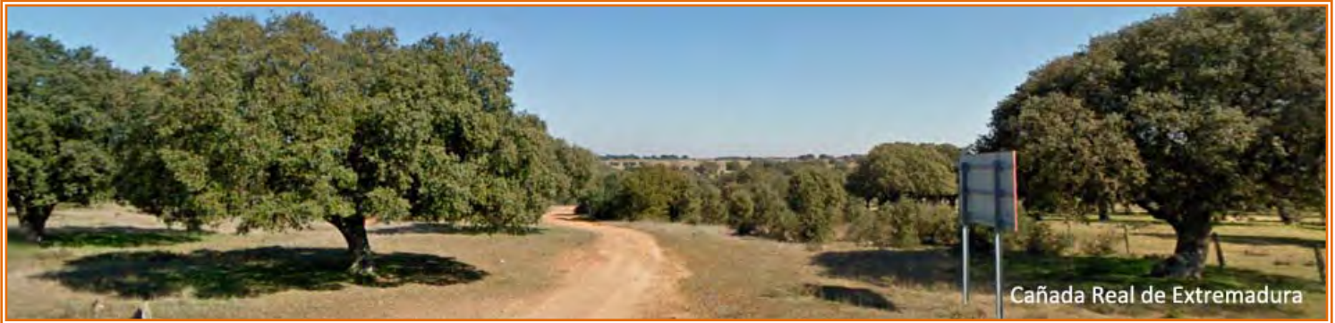
Cañada Real de Extremadura

entre campos adehesados y en algo menos de 8 km dejamos por la derecha al caserío de Cuarto de Sánchez Arjona, unos centenares de metros después cruzamos otra carretera, que por la izquierda lleva hasta Aldehuela de la Bóveda, y seguimos por la cañada.