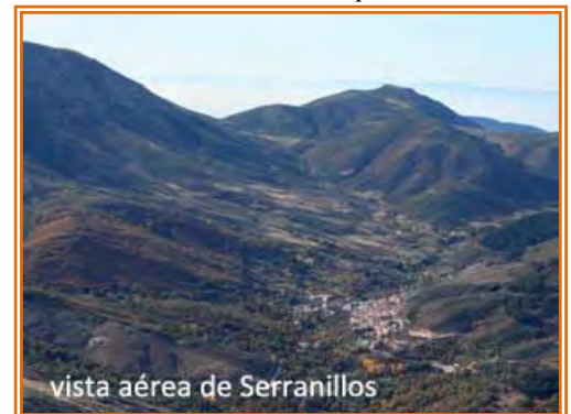
vista aérea de Serranillos