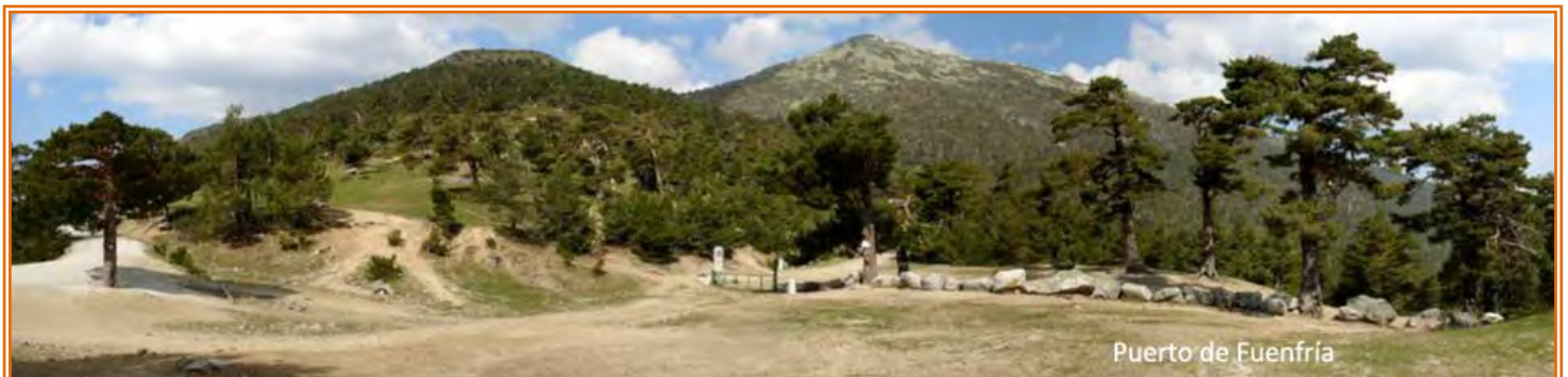
Puerto de Fuenfría

sentido contrario por el Camino de Madrid que atraviesa las tierras castellanas hasta Sahagún. Después de la fuente nos quedan unos 3,5 km hasta el puerto de la Fuenfría que ejerce de frontera entre CC. AA.